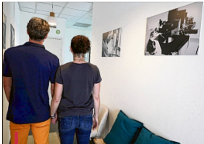
Au centre d'Urbain V, tout est à portée de main pour les couples infertiles, aussi bien pour la partie diagnostic que thérapeutique.

La prise en charge des couples infertiles se fait en trois temps: le bilan initial, la visite chez un gynécologue spécialiste en fertilité (qui prescrit un traitement de stimulation) et le rendez-vous avec la biologiste. "Dès qu'il y a un spermogramme pathologique, on revoit les couples rapidement", souligne le Dr Scalici. Le centre AMP d'Urbain V travaille aussi avec un masseur certifié; une psychologue clinicienne fait également partie du staff.