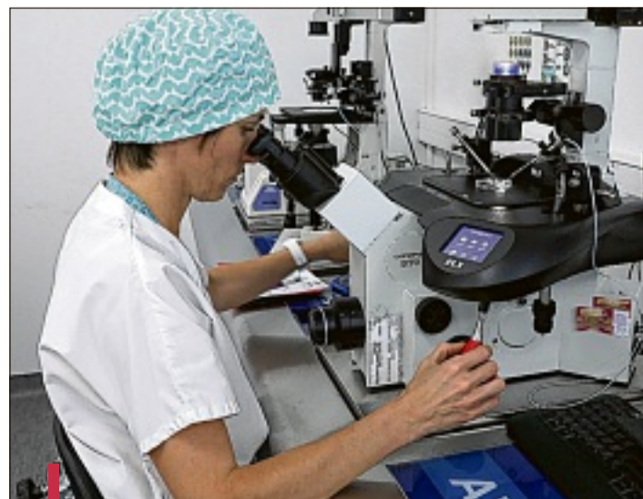
Ici, la microinjection: l'ovule est fécondé avant d'être placé dans les incubateurs de dernière génération, "des énormes couveuses".